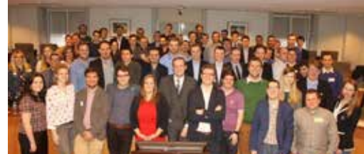
N-VA-jongeren roeren zich in Merksplas p.3