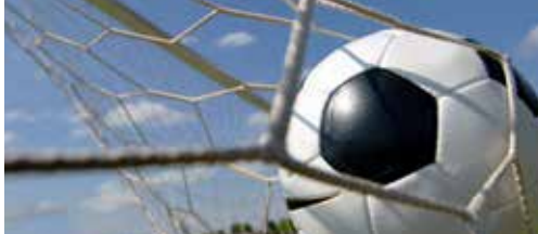
Goed nieuws voor lokale verenigingen p.2